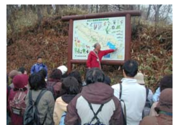
自然ガイドの解説を受ける参加者

アンケートの結果も大変高い評価を受けており、今後の観光ツアーとしての確立が期待されます。